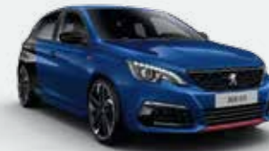
Sinine Magnetic / Must Perla Nera**