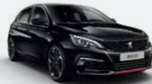
Must Perla Nera**