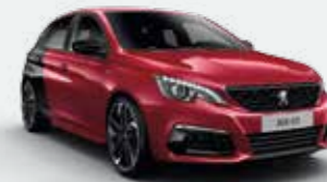
Punane Ultimate / Must Perla Nera**