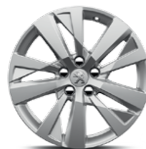
17" valueljed CHICAGO*