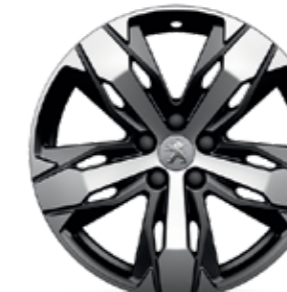
18" valueljed LOS ANGELES*