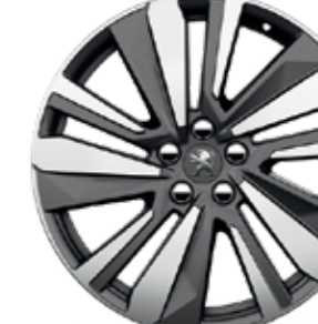
19" valueljed WASHINGTON*