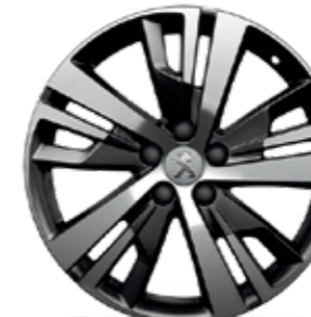
18" valueljed DETROIT*