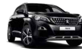
Must PERLA NERA*