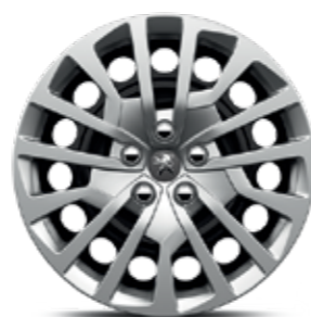
17" terasveljed ja ilukilbid MIAMI*

* sõltuvalt valitud varustustasemest ja lisavarustusest